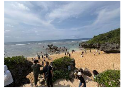
2日目 古宇利島散策