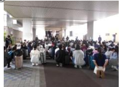
1日目 大阪国際空港での集合

今回の修学旅行で得た経験や学びを、今後の学校生活にしっかりと生かして欲しいと願っています。保護者の皆様には、事前の準備から当日の対応まで、様々なご支援をいただき、心より感謝申し上げます。